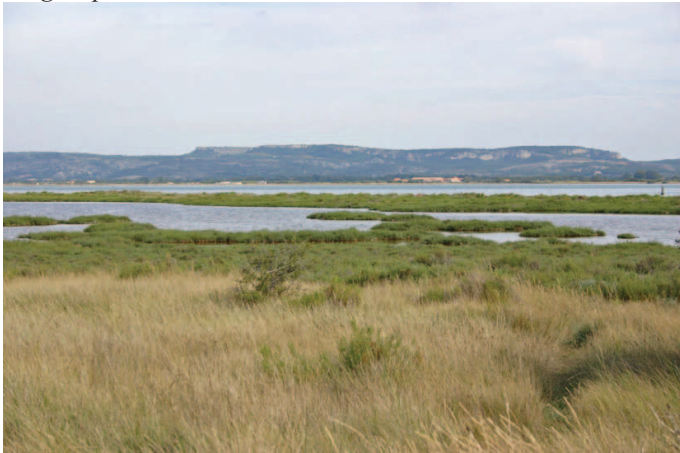
Étangs et massif de la Clape vus depuis Bages