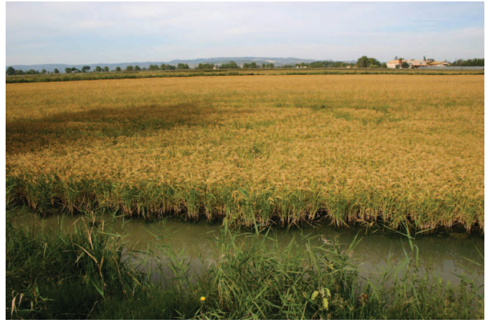
Rizière près de Mandirac, massif de Fonfroide en fond