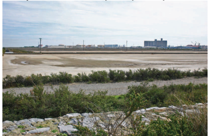
Salins et silhouette industrielle de Port La Nouvelle