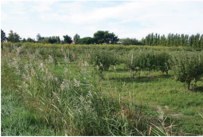
Vergers près de Craboulette