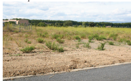
Friche et développement d'habitat aux abords du Somail. En arrière plan le Canal du midi est signalé par ses alignements