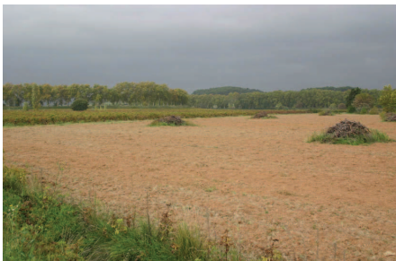
Méandre du Canal près d'Argeliers. Arrachage de vigne en premier plan.