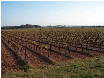
Plaine viticole ponctuée de grands domaines à Ouveillan

Ce paysage à dominante viticole où le canal, adossé aux microreliefs au nord, est en situation de belvédère sur la plaine au sud, cas unique à l'échelle de l'itinéraire, se banalise et devient confus au contact de la périurbanisation se développant aux abords de Béziers et de Narbonne.