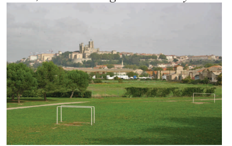
Cathédrale Saint Nazaire signalant la vieille ville de Béziers vue depuis les abords des écluses de Fonsérannes