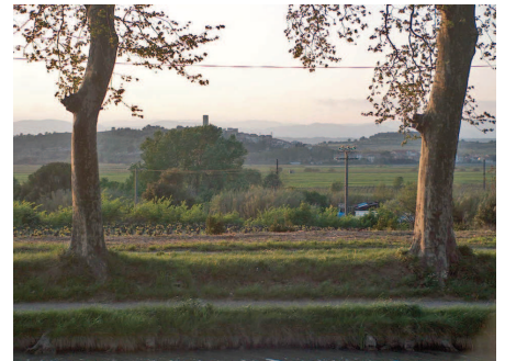
L'étang asséché de Montady jouxtant le canal, butte et village de Montady