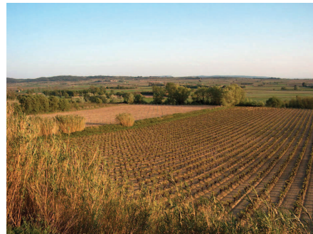
Collines de Nissan-lez-Ensérune en arrière-plan