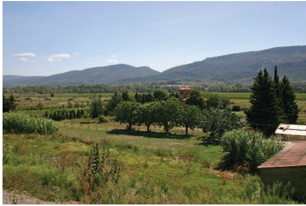
Vallée de l'Aude près de Millegrand, Alaric en fond