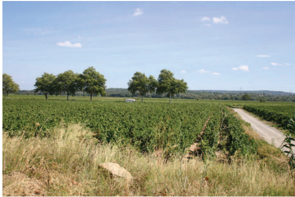
Plaine viticole et collines d'Escales en fond près de Puichéric