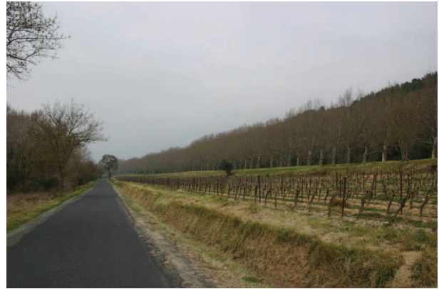
Défilé de l'Aude entre Olonzac et Argens Minervois