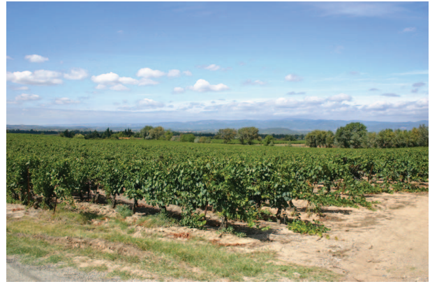
Ancien étang de Marseille et Montagne Noire dans le lointain