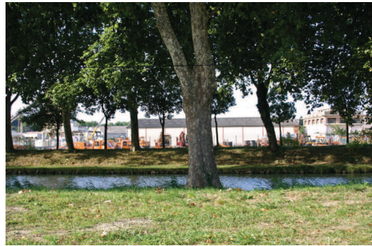
Façade industrielle à l'ouest de Carcassonne