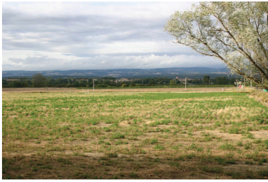
Alzonne et la montagne Noire en arrière plan