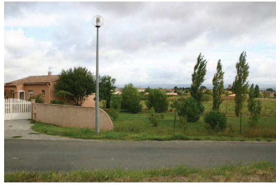
Extensions bâties de Villesèquelande aux abords immédiats du canal