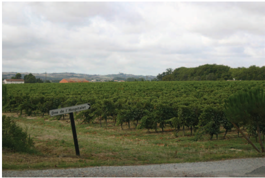
Collines de la Piège et Montréal en point d'appel près de St Eulalie