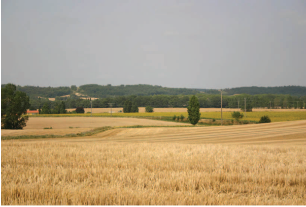
Paysage agricole à l'ouest de Castelnaudary, collines de la Piège en fond