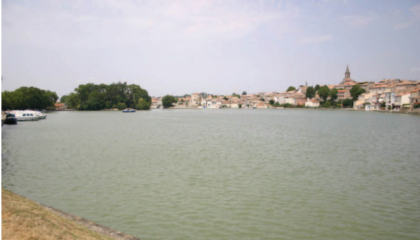
Castelnaudary - le grand bassin