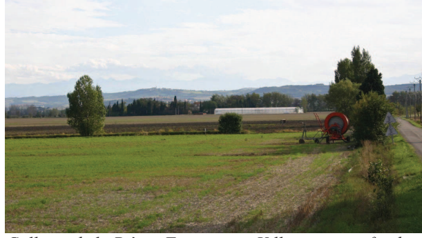
Collines de la Piège, Fanjeaux et Villasavary en fond