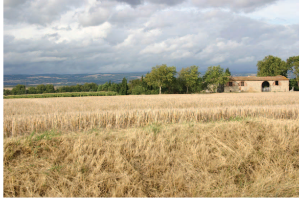
Paysage agricole à l'est de Pexiora, montagne Noire dans le lointain