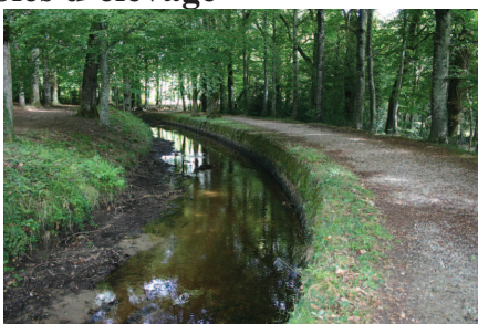
Section courante de la rigole