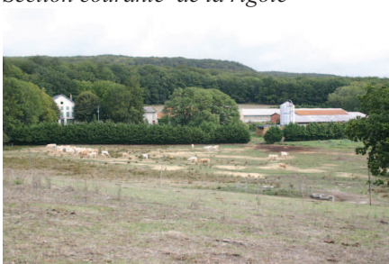
Exploitation agricole– Les Cabanelles