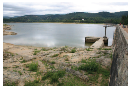
Retenu de St Ferréol