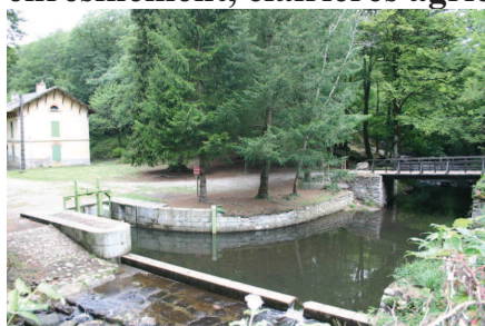
Prise d'eau d'Alzeau

La montagne Noire se caractérise par des paysages et un climat de montagne, hêtraie, enrésinement, clairières agricoles d'élevage