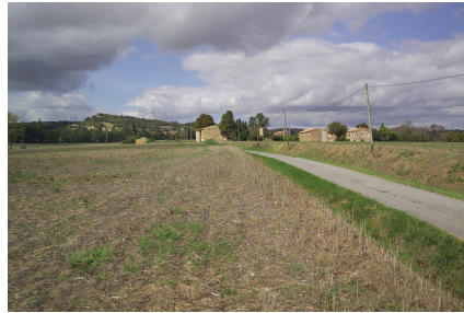
Hameau agricole aux abords de la rigole