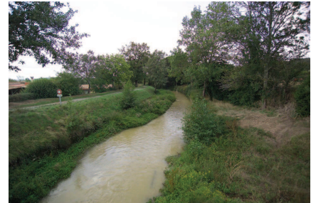
La rigole section courante