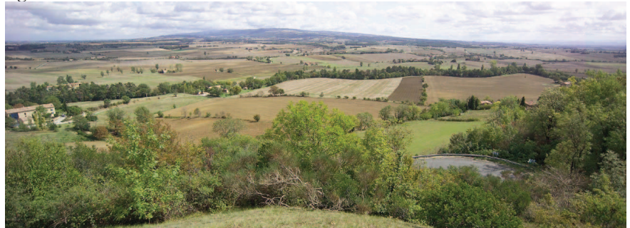
La rigole de la plaine vue depuis Saint Paulet