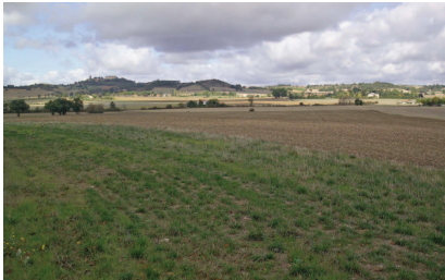
La plaine agricole de Revel épaulée à l'ouest par la cuesta de Saint Félix Lauragais