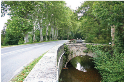
Pont Crouzet, origine de la rigole de la plaine