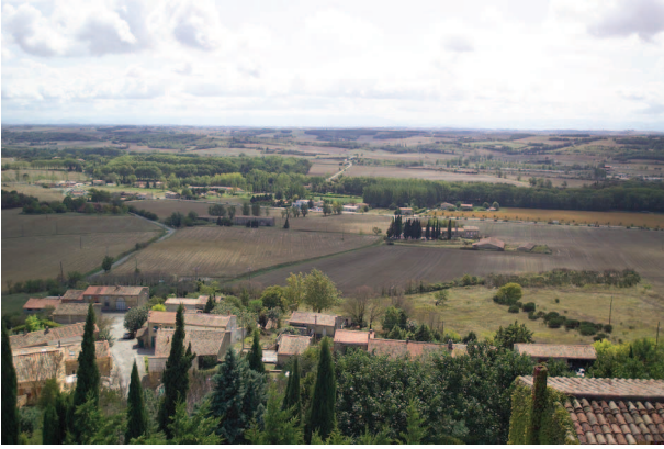
Le seuil de Naurouze vu depuis le village de Montferrand