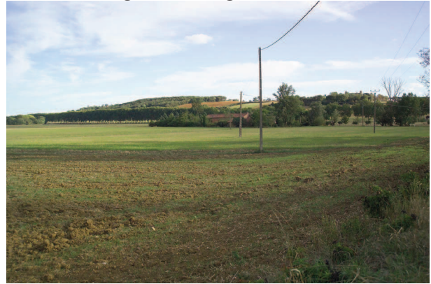
Le coteau agricole et boisé au Sud à Vieilleville