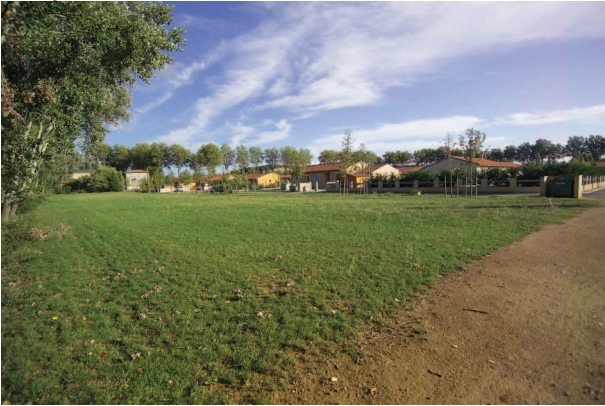
Extension urbaine récente en bordure du Canal à Gardouch