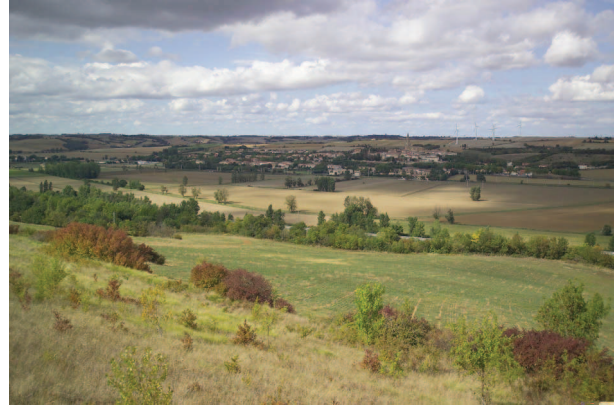
Le sillon agricole épaulé par les coteaux au nord, silhouette d'Avignonet-Lauragais