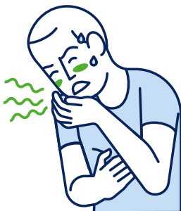
Vertiges / Nausées