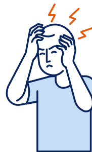
Maux de tête