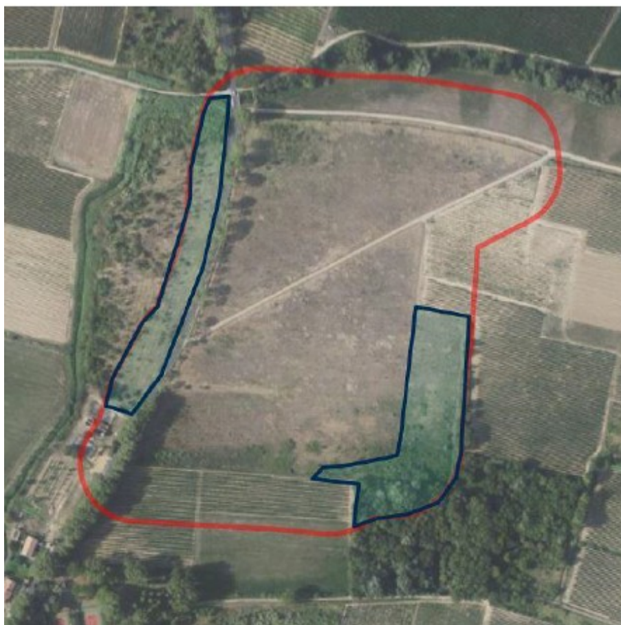
Figure 3 : la carte ci-dessus présente en bleu les zones concernées par les débroussailllements SDIS – réalisation TotalEnergies