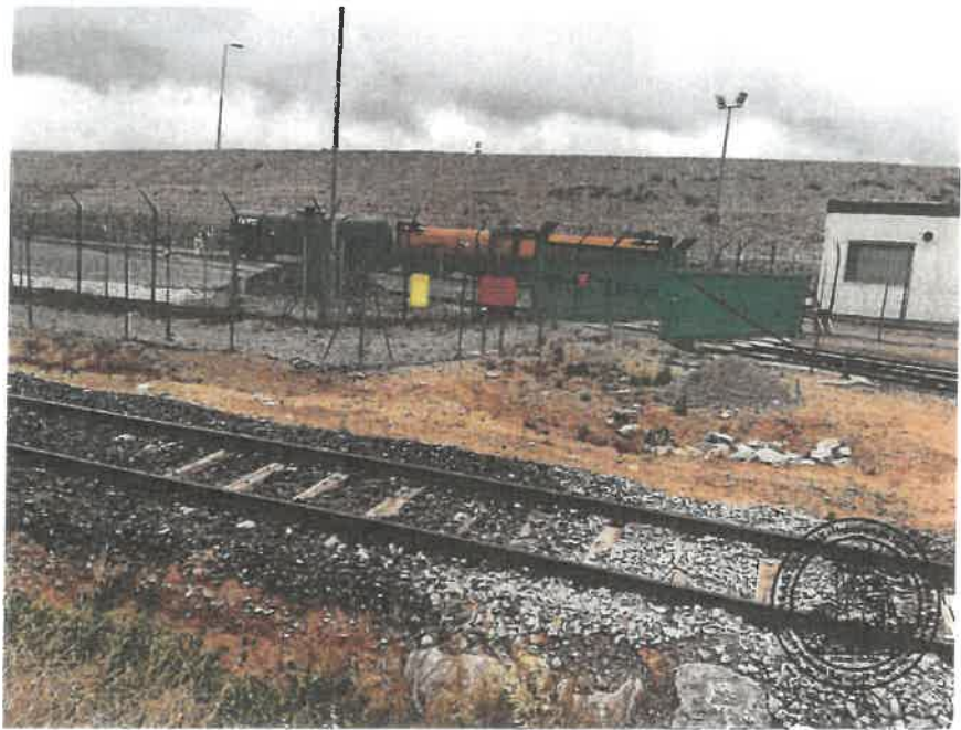
GPS : Latitude=43.21112, Longitude=2.98134, Altitude=11.51 m, Angle:350.13° Précision verticale=4.79m, Précision horizontale=3.30m,