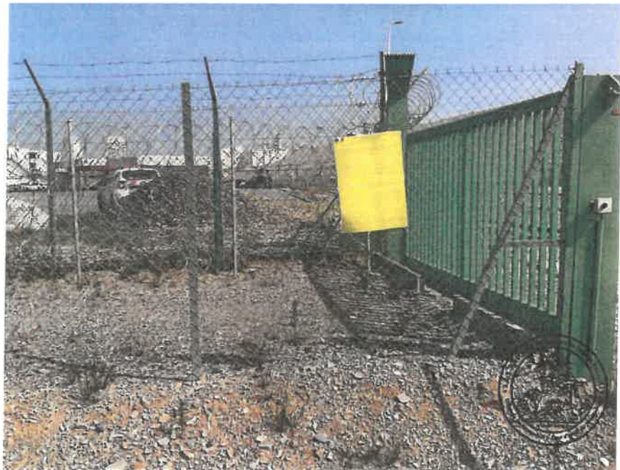
GPS : Latitude=43.21122, Longitude=2.98152, Altitude=11.55 m, Angle:256.77° Précision verticale=4.73m, Précision horizontale=3.38m.