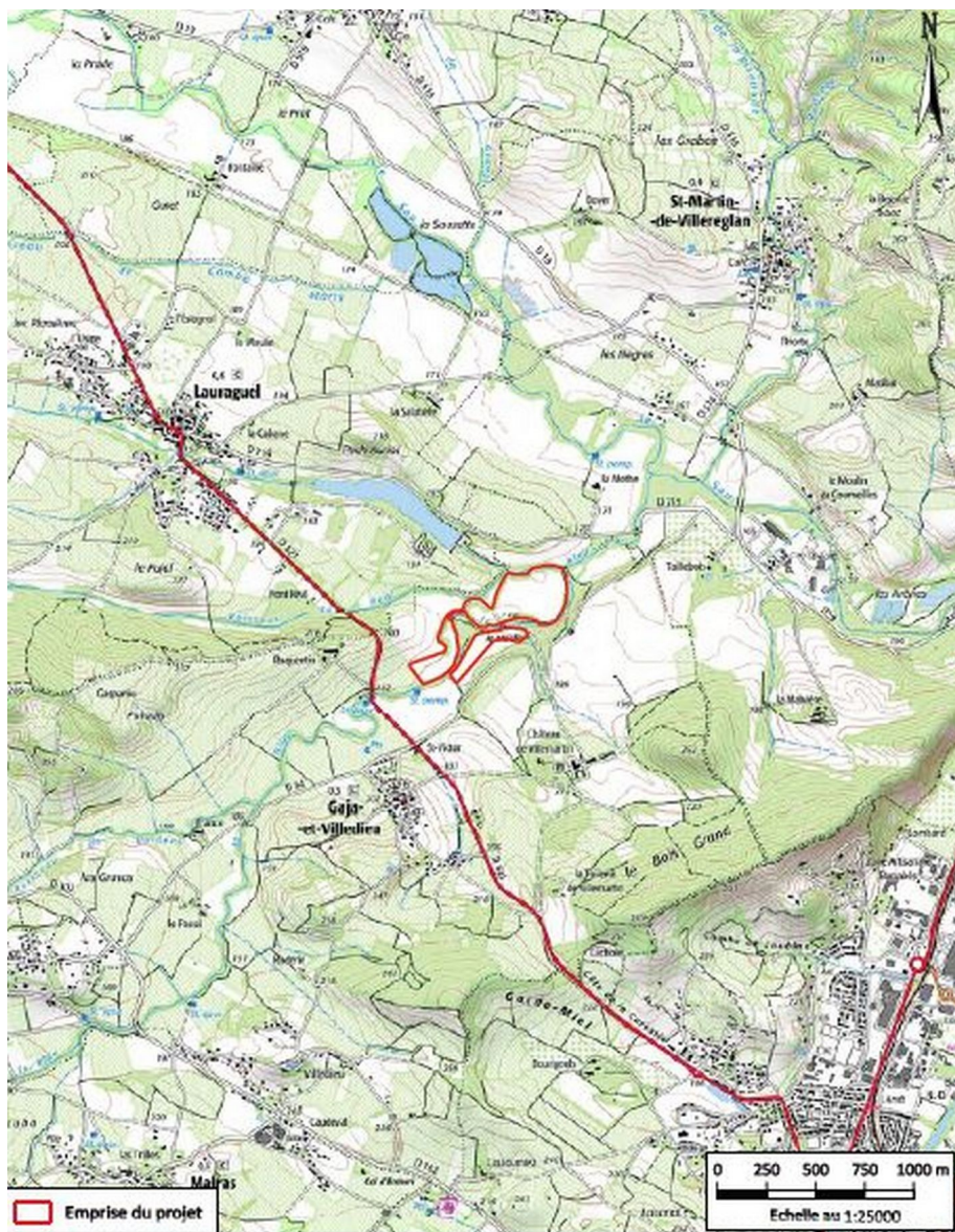
Figure 1: Situation du projet

Le projet se trouve à environ 700 m au nord-nord-est du bourg de Gaja-et-Villedieu. La société exploite plusieurs sites dans un rayon d'une vingtaine de kilomètres.