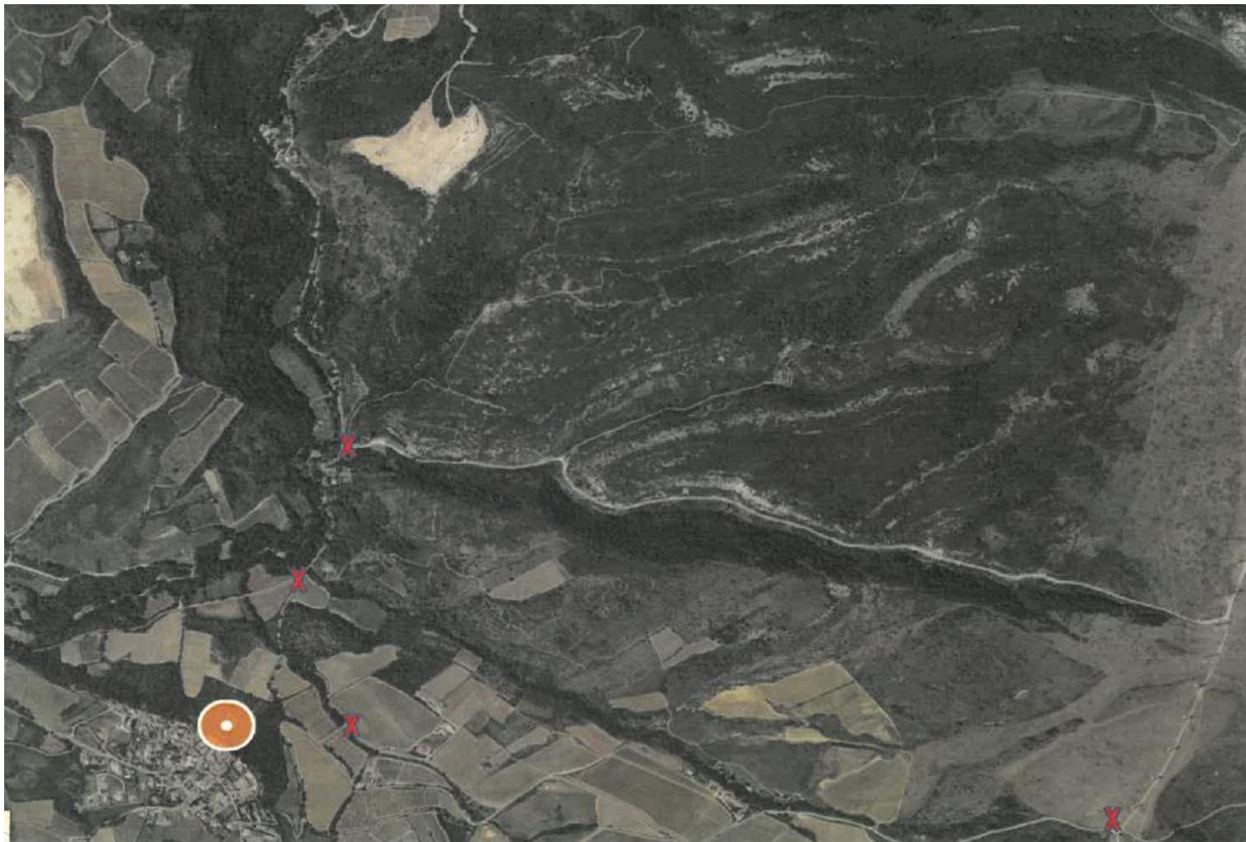
annexe 2a localisation Affichages panneaux EP ROQ

2 accès principaux au parc Nord + 1 accès de Roquetaillade + 1 panneau sur site