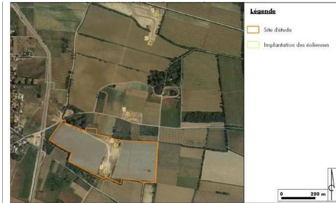
Figure 2: Localisation du site d'étude et implantation des éoliennes

Le parc photovoltaïque au sol de Cuxac d'Aude, d'une puissance d'environ 3,2 MWc sera composé de 8 064 panneaux photovoltaïques d'environ 400 Wc unitaire, sur une surface globale clôturée de 6 ha. Les panneaux photovoltaïques seront de type silicium monocristallin fixés au sol par des pieux battus ou vissés avec une hauteur maximale de 4,6 m par rapport au terrain naturel. Le parc sera également composé d'un poste de livraison situé au nord-ouest de la zone d'implantation sur la même emprise que le point de livraison ENEDIS de la centrale éolienne existante, d'un poste de transformation, au centre de la ZIP 2 et d'une citerne incendie de 120 m 3 .