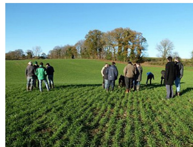
Technique de conservation des sols par labour peu profond - Groupement d'intérêt écologique et économique (GIEE) de Boussac (Creuse)