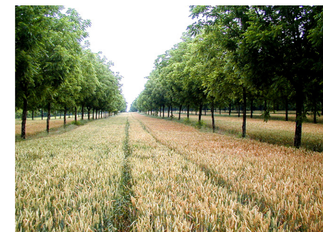
Agroforesterie - Céréales et noyers - Charente-Maritime (Association Agroforesterie)