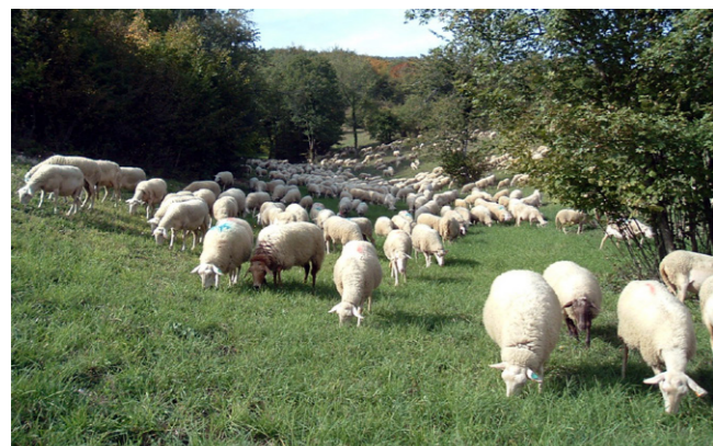
Pâturage de regain - Ain (D. et C. Roupé)