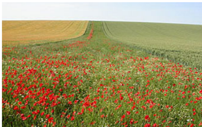
Jachère spontanée - Saint-Jean-sur-Tourbe (LPO Champagne-Ardenne)