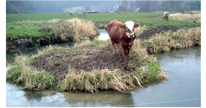
Prétinement des berges par les animaux par absence de clôture (s2rivieres)