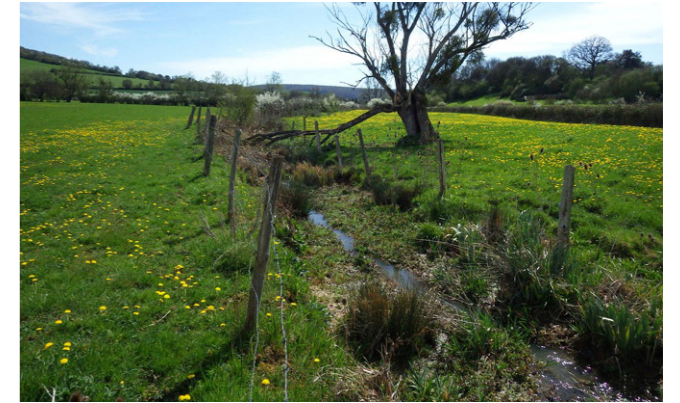
Mise en défens des berges - Nièvre (Rivières Nièvre)