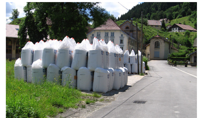
La pollution par les nitrates (CPEPESC)