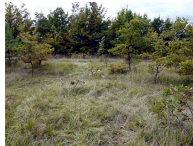
Prairie en voie d'enrichissement - Vienne (Lycée Agrotec)