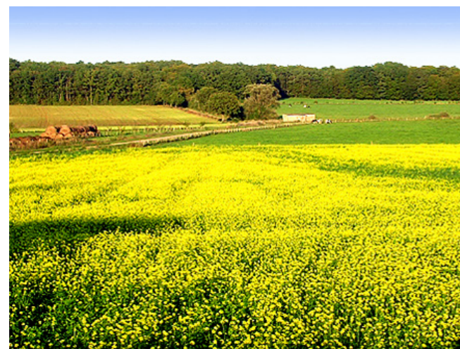
Culture intermédiaire piège à nitrates (CIPAN) qui permet de réduire le lessivage des nitrates, l'érosion des sols - CIPAN de colza sur l'exploitation de Jacques Poincot (Meurthe-et-Moselle)