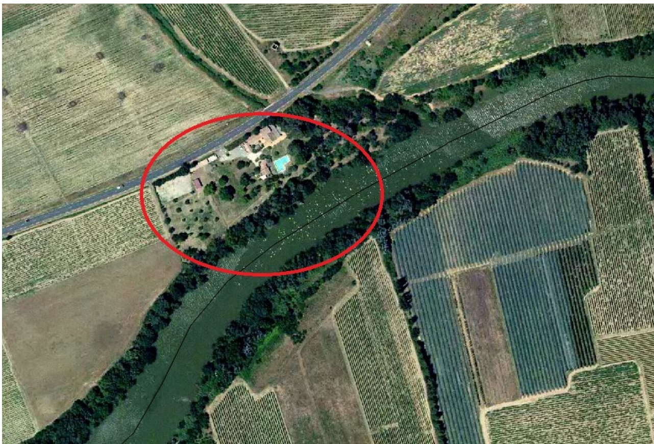
Situation du domaine concerné par l'acquisition amiable.

une moindre mesure ceux du Canal du Midi. Ces nombreux affluents ont suivi une temporalité différente qui rend la prévision et l'anticipation très complexe. Ainsi, l'anticipation seule de l'Aude par le Service de Prévision des Crues (SPC) ne peut suffire à garantir la sécurité de ce domaine de l'Aqueduc. A cela s'ajoute le fait que l'évacuation est rendue très compliquée car les voies d'accès sont rapidement inondées.