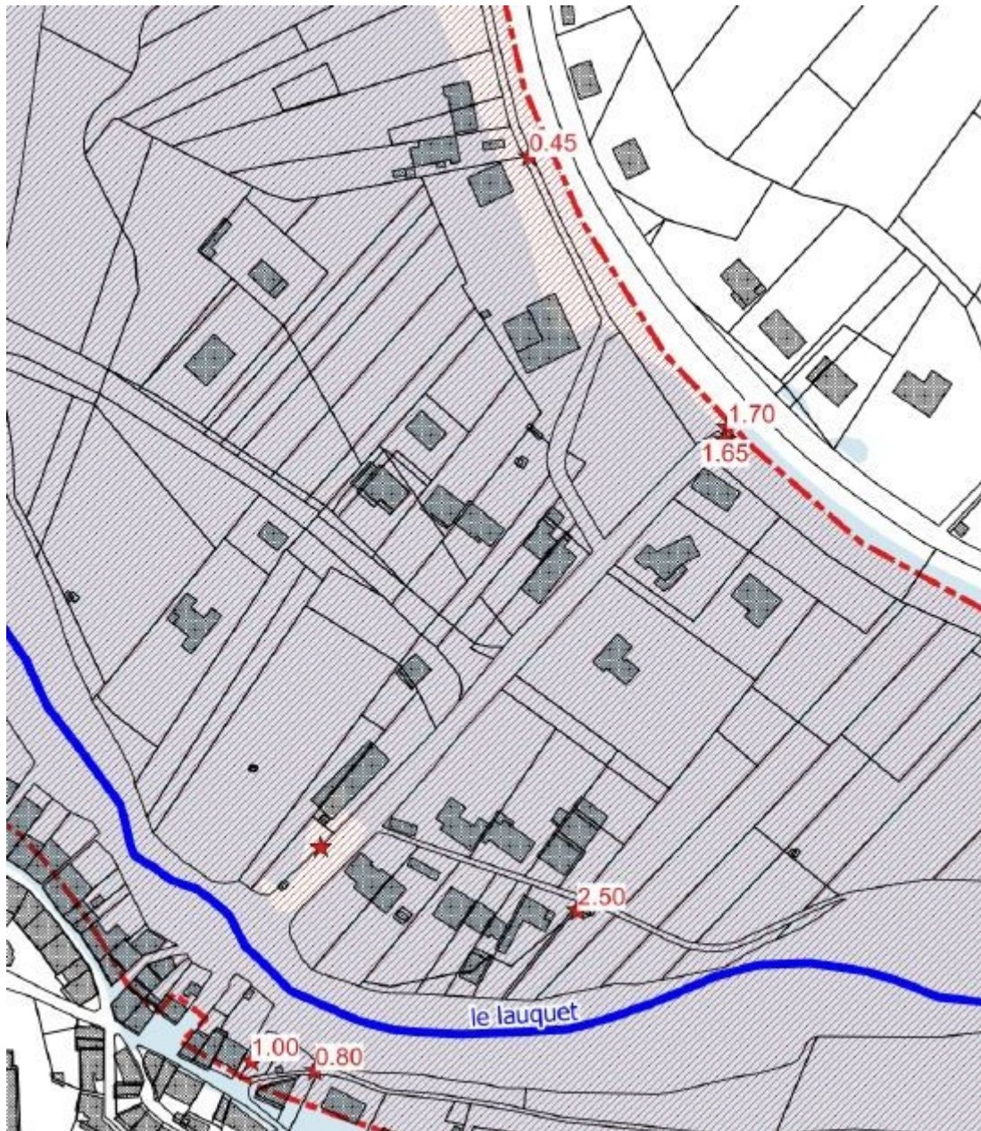
Extrait de la carte de l'emprise inondée par le Lauquet le 15 octobre 2018 et hauteurs d'eau relevées