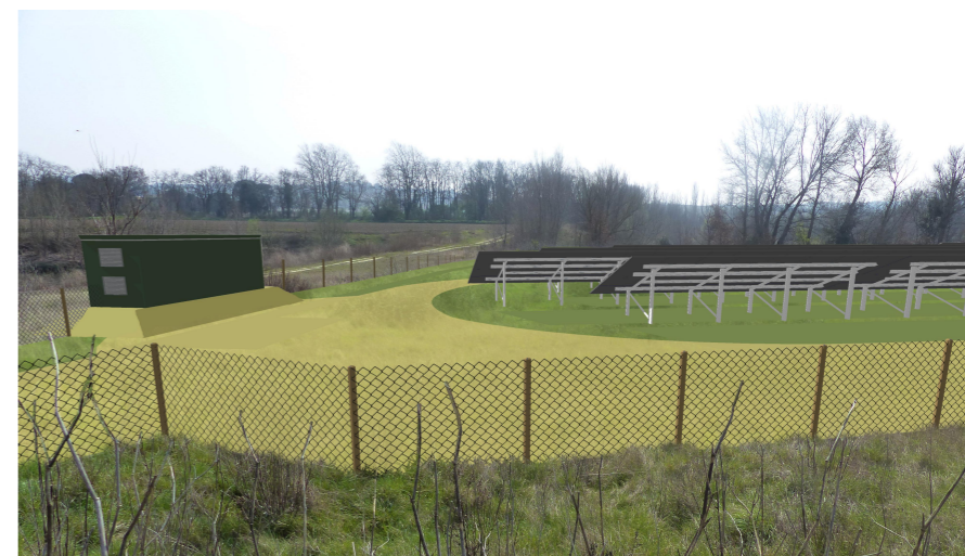
Point de vue n°3