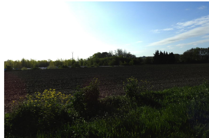
Point de vue n°1