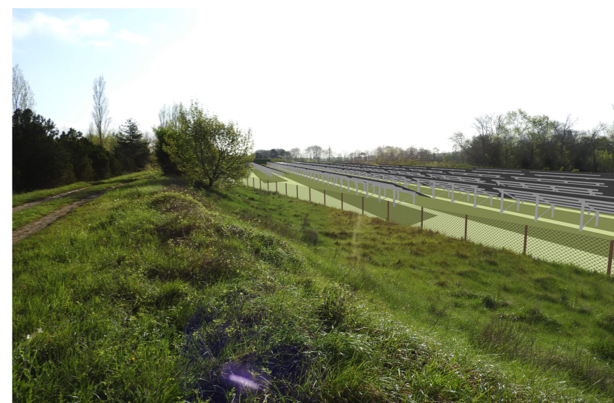
Point de vue n°2