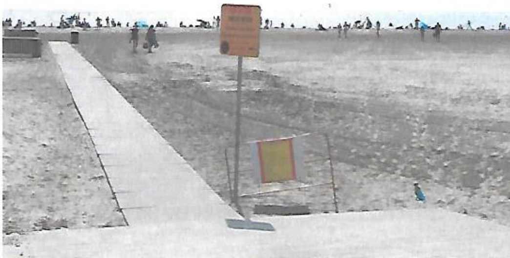
Vue de l'affichage de l'avis d'E.P. au niveau de l'accès à la plage du Front de Mer, à proximité du parking du casino.