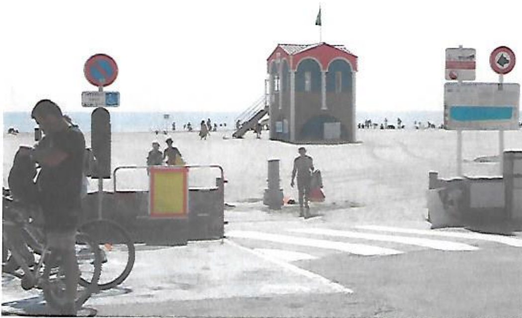
Vue de l'affichage de l'avis d'E.P. au niveau de l'accès à la plage du Front de Mer vers le poste de secours n° 2.