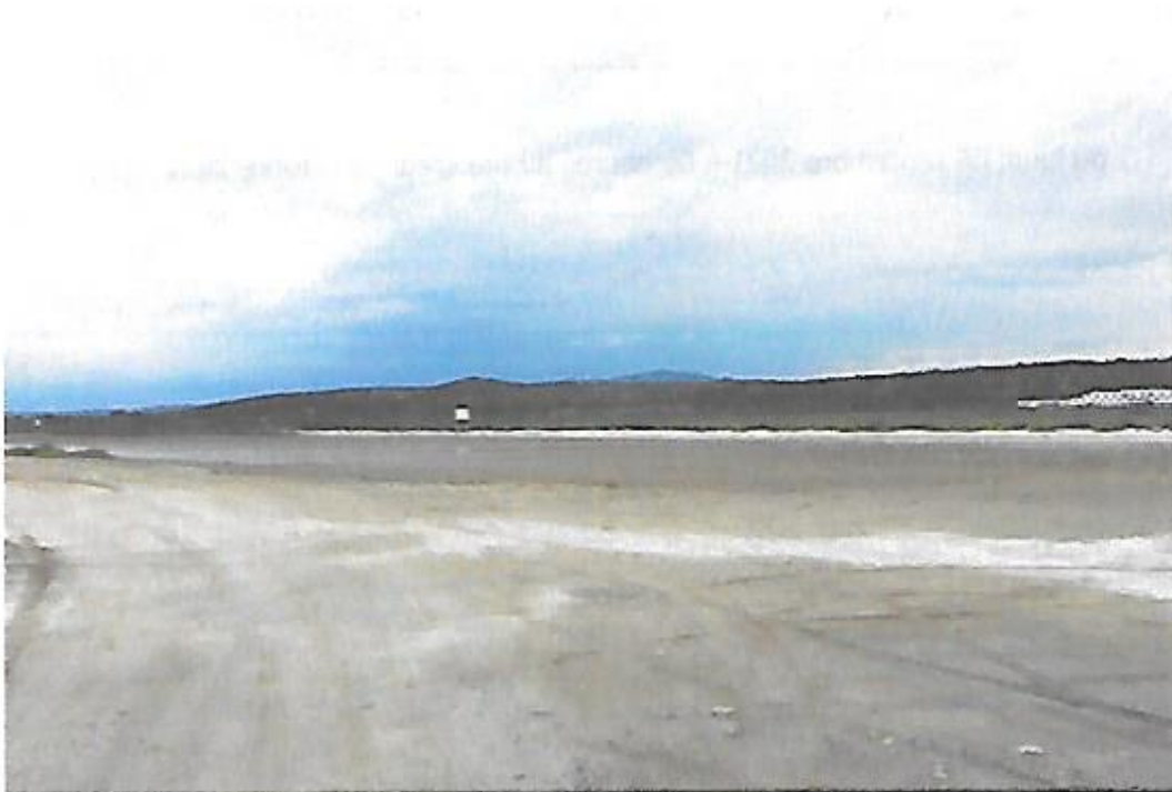
Vue de la plage des Montilles en direction de La Palme, prise le 23 juin 2021 depuis l'entrée de la plage à l'extrémité du boulevard Eschasseriaux.