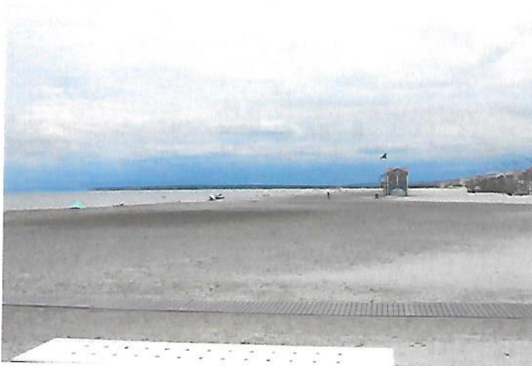
Vue de la plage du Front de mer à son extrémité Sud prise le 23 juin 2021.