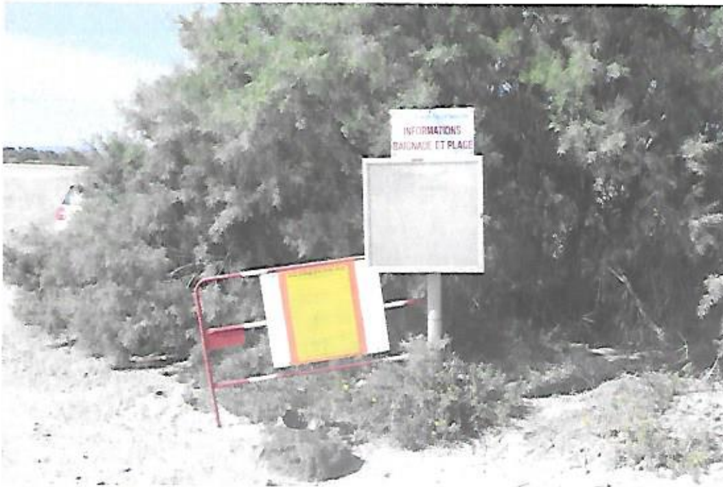
Vue de l'affichage de l'avis d'E.P. à l'entrée de la plage des Montilles