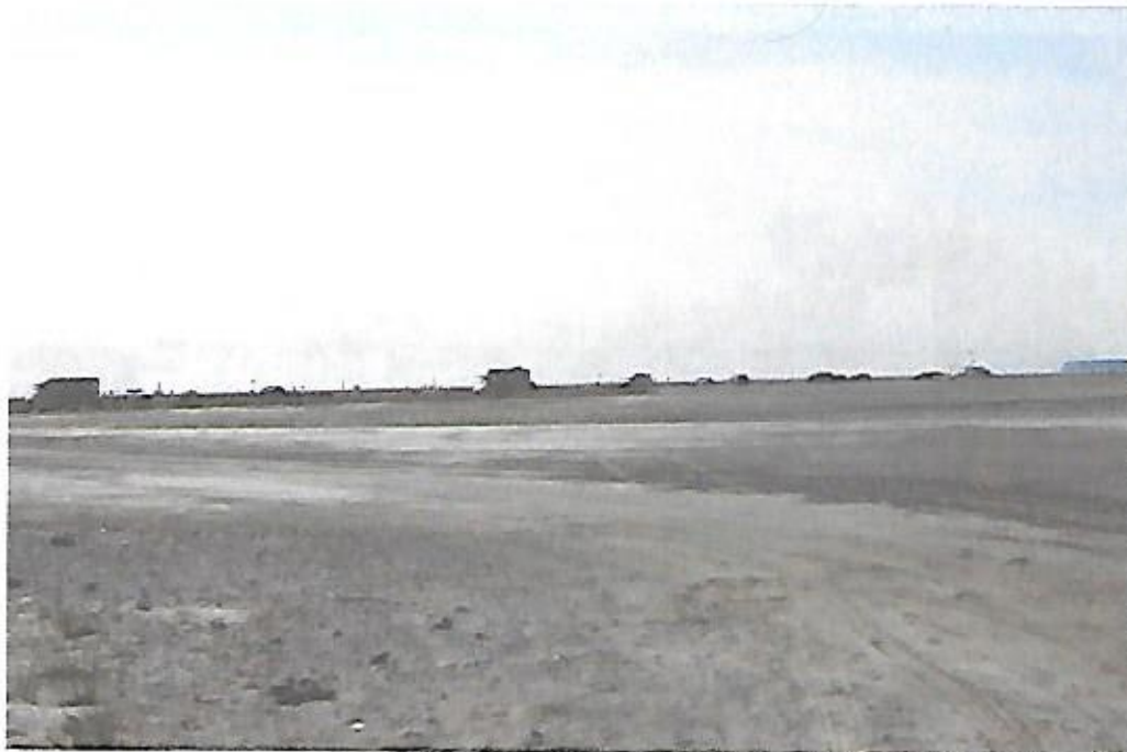
Vue de la plage des Montilles dans sa partie Sud en direction de La Palme prise le 25 août 2021. Divers véhicules sur la plage.