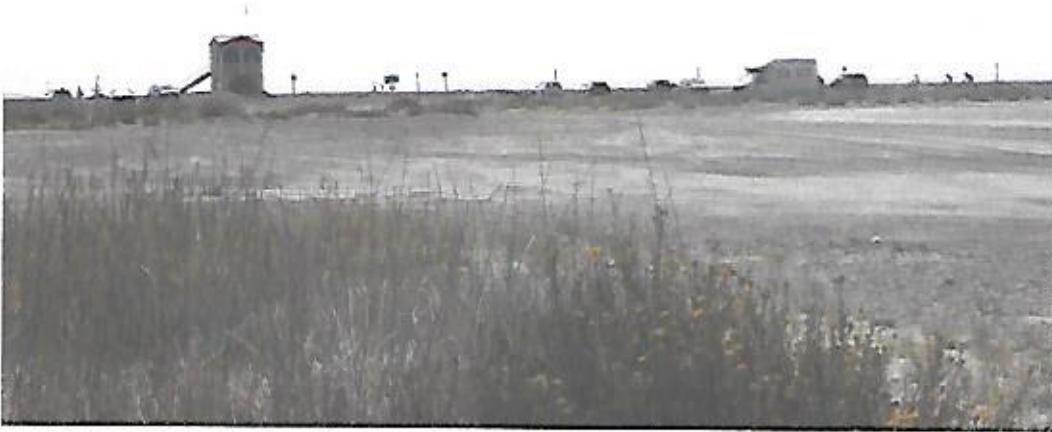
Vue de la plage des Montilles prise le 25 août 2021 au niveau du poste de secours n° 3.