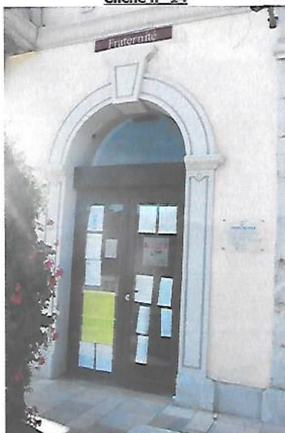
Vue de l'affichage de l'avis d'E.P. sur la porte de la mairie.