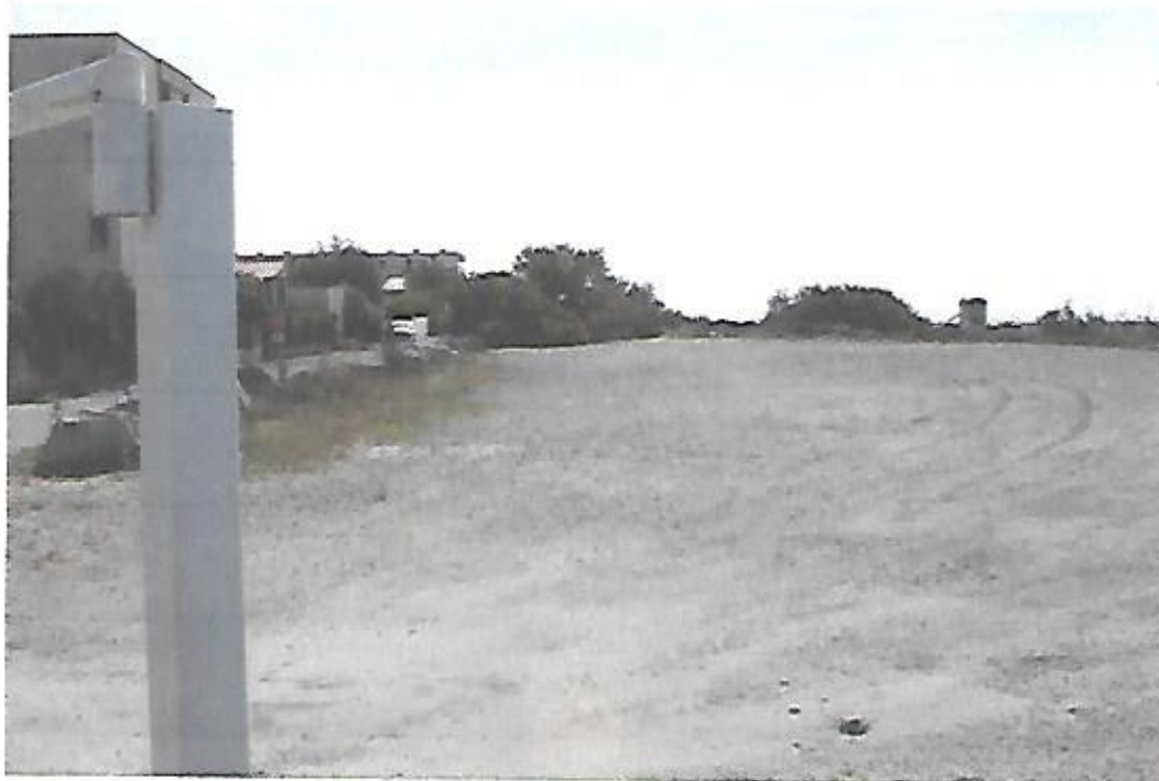
Vue du chemin des Vignes en direction du centre de Port la Nouvelle prise le 25 août 2021. Au premier plan, parking inemployé à l'entrée de la plage des Montilles.