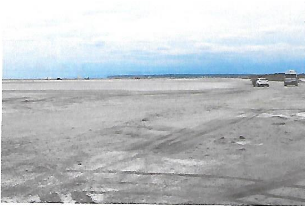
Vue de la plage des Montilles prise le 23 juin 2021 depuis cette même entrée. Au premier plan, véhicules circulant sur la plage. Au fond, on aperçoit de nombreux véhicules stationnés en bordure de mer.