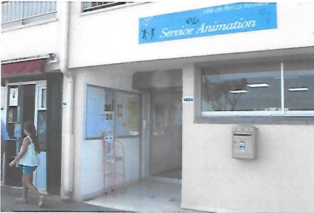
Vue de l'affichage de l'avis d'E.P. sur le panneau d'affichage du service d'animation.