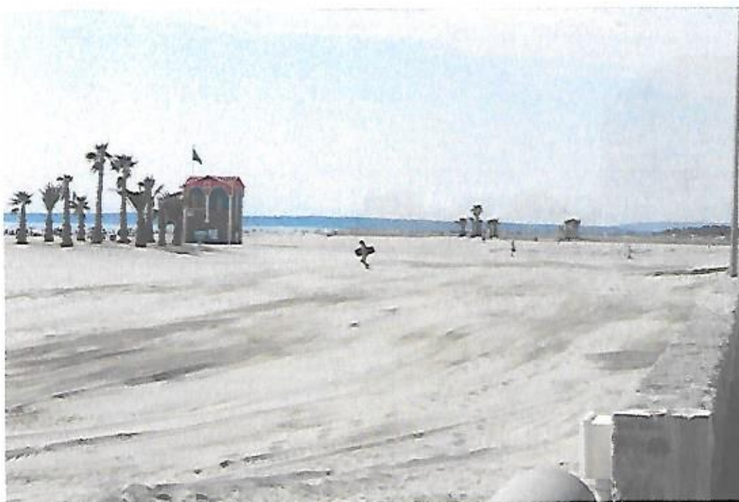
Vue de la plage du Front de Mer avec deux palmeraies rapportées.