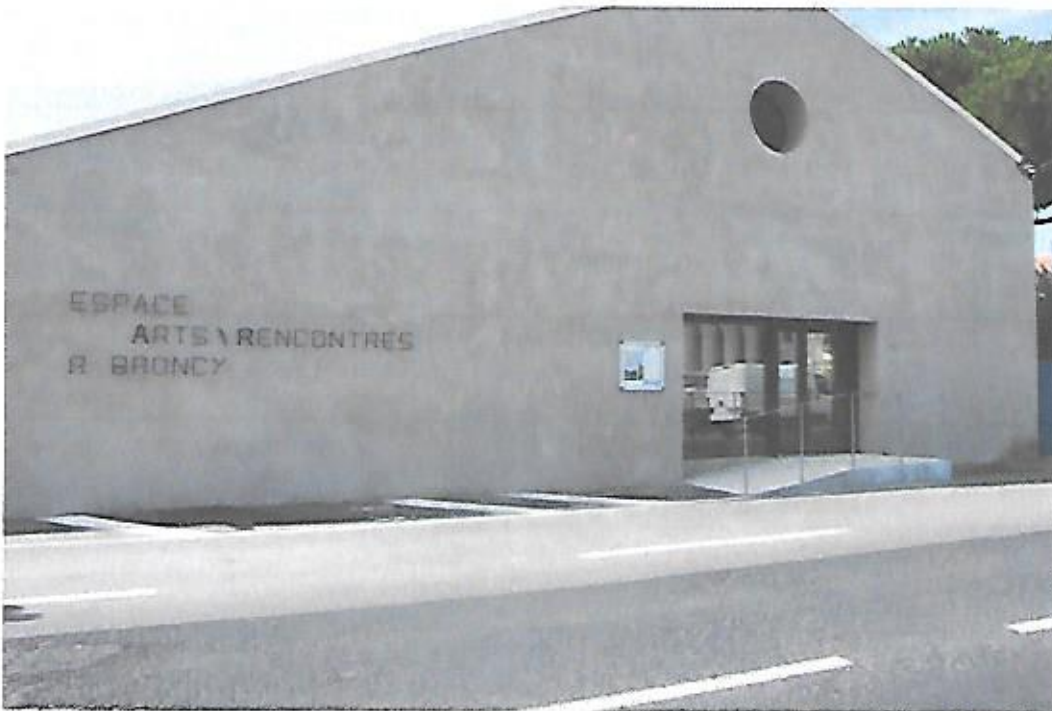
Vue de l'affichage de l'avis d'E.P. sur la porte d'entrée de l'espace culturel Roger Broncy.