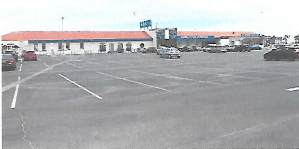
Vue du parking du Casino contigu au nord de la plage du Front de Mer prise le 23 juin 2021.