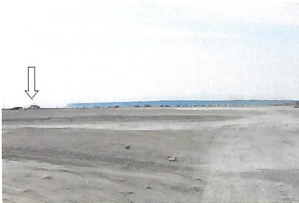
Vue de la plage des Montilles avec de nombreux véhicules en bordure du rivage. La flèche indique le poste de secours n° 4