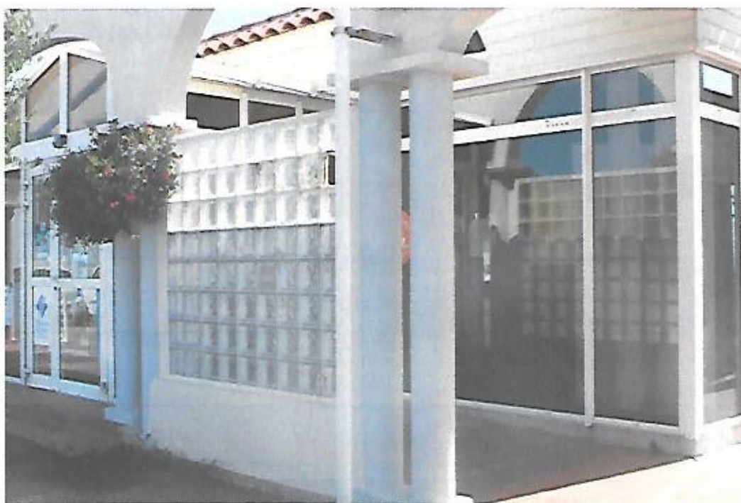
Vue de l'affichage de l'avis d'E.P. sur la vitre latérale de l'office du tourisme.