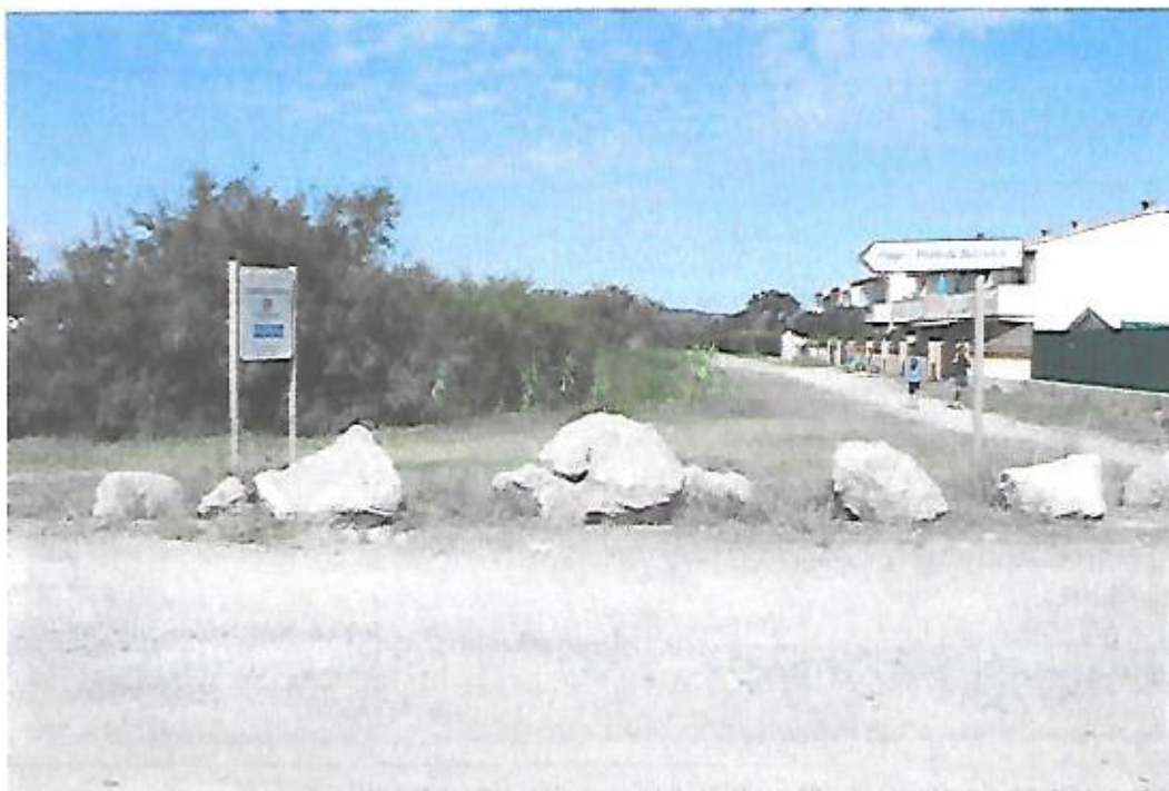
Vue du chemin des Vignes en direction de La Palme au niveau de l'entrée de la plage des Montilles.