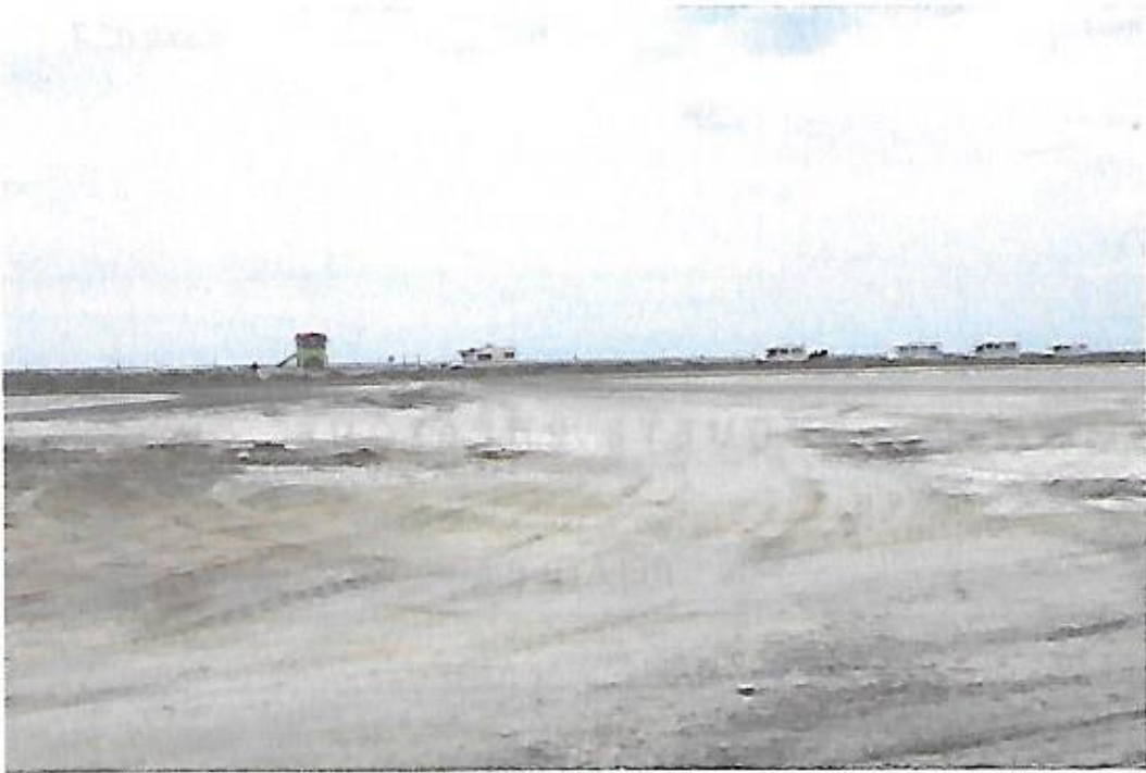
Vue de la plage des Montilles prise le 23 juin 2021. Camping-cars stationnés en bordure de plage.