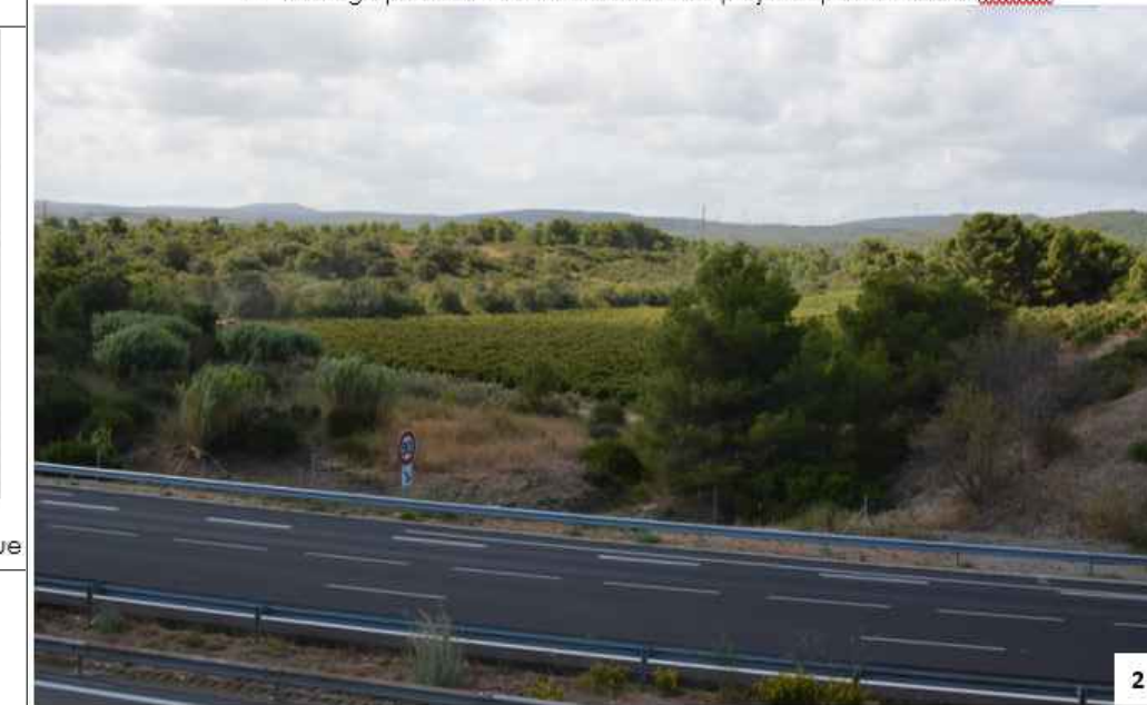
Photographie 60 : Vue initiale du site de projet depuis le pont de la RD3