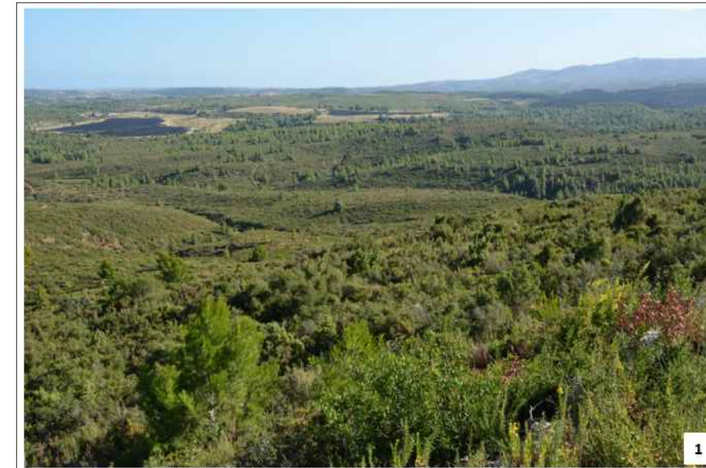
Photographie 58 : Vue initiale du site de projet depuis le Pla Dal Teïssou